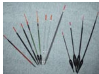
Välj ett långsmalt flöte till sutarmetet. Flöten med flytkropp kan kastas längre men har inte lika känslig nappindikation.