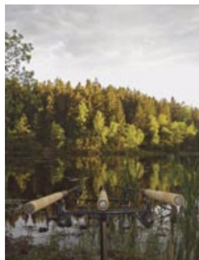
Redo för sutare! Bottenmete med elektroniska nappalarm en vacker försommarkväll.

Förhoppningsvis har ingen undgått att notera de många möjligheter och variationer som sutarmetet erbjuder. Men oavsett vilken metod eller strategi du själv väljer för ditt sutarmete så kommer du inom ett begränsat antal försök att komma i kontakt med en av landets häftigaste fiskar. Dessutom kommer detta att ske i en smått magisk och slumrande omgivning där lugnet endast bryts genom drillningen av en ursinnig och riktigt stark fisk. Sutarmete är fantastiskt – prova du också!